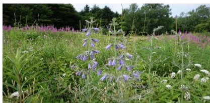
ツリガネニンジン