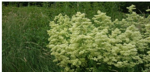
エゾカワラマツバ