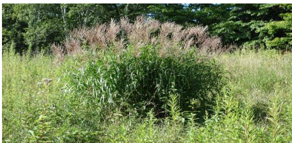
これからの主役エゾノコンギク